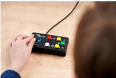
Steuerung in Verwendung mit PC-Bildschirm (my Board Buddy AIR)

kann am Computer des Lehrers oder Dozenten oder an einer interaktiven Wandtafel angeschlossen werden. Schüler und Studenten können mit my Board Buddy digitale Präsentationen drahtlos via eigenem Wlan Signal auf einem Tablet mit iOS und Android oder auf einen Bildschirm mit HDMI Anschluss auf Wunsch vergrössert und in invertierter Darstellung verfolgen.